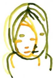
Illustratie: Jan Rothuizen